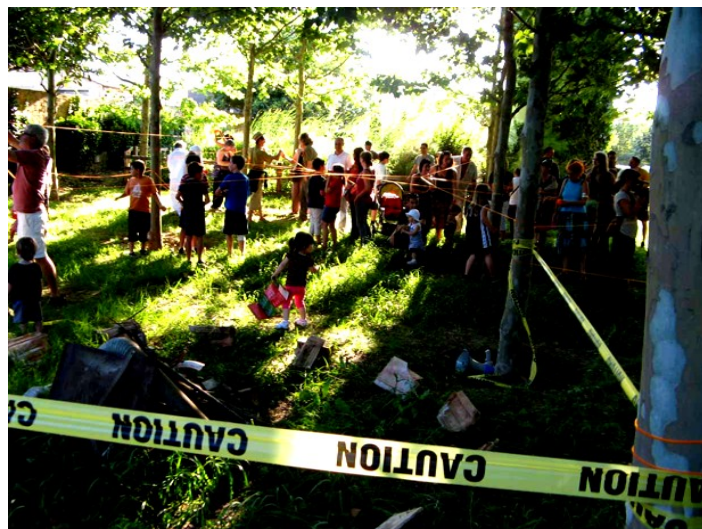
Y las líneas vitales fueron trazadas con resolución, dinamismo y fluidez