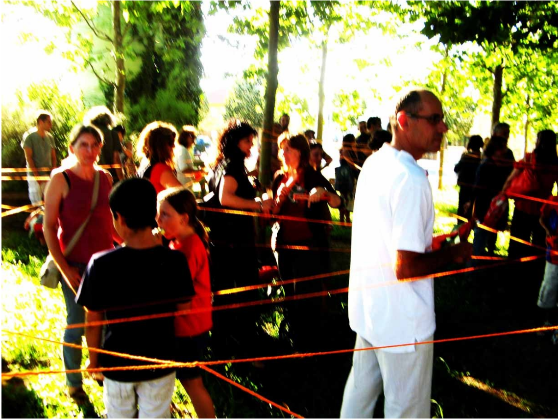
El ambiente festivo se fue extendiendo rápidamente