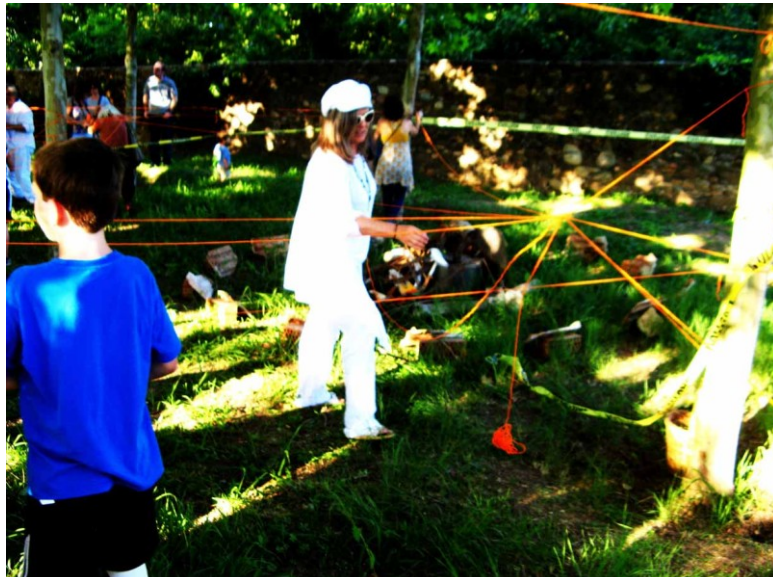
El elemento de interconexión formaba parte del proceso y fue ejecutado con gran precisión