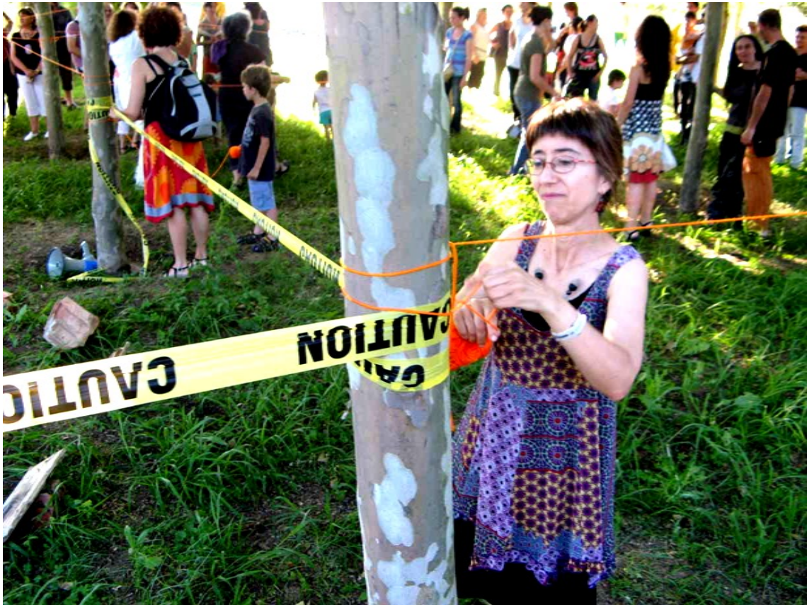
La participación de los asistentes fue del cien por cien