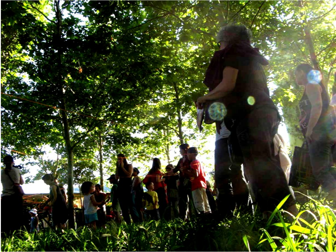
La expectación era enorme pues era el primer referéndum de este tipo que se celebraba en Europa