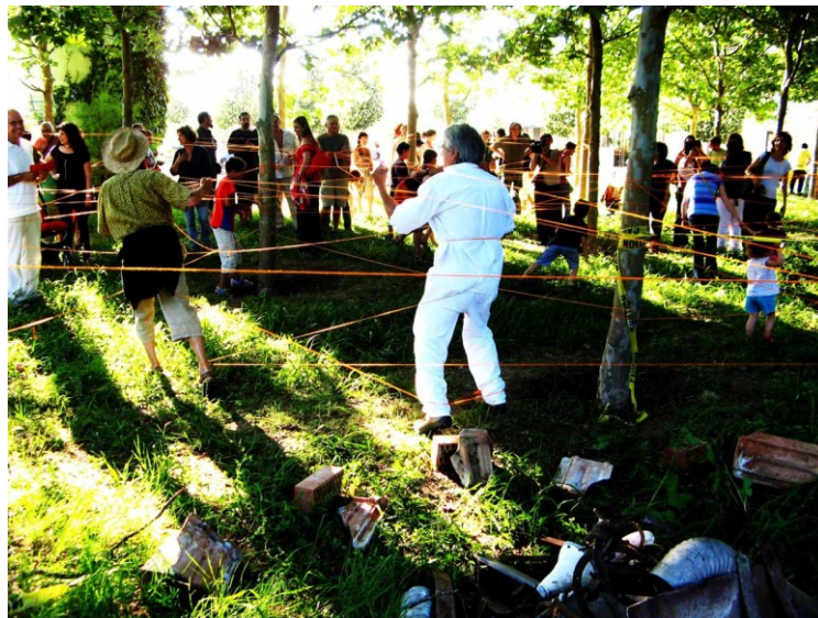
Y las coordenadas trazadas por todos los participantes crearon un espacio alternativo demostrando, de esta forma, que otro mundo es posible.