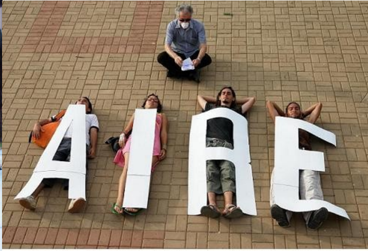
Aire, Instalación cum Performance, Edo. Falcón, Venezuela, 2007