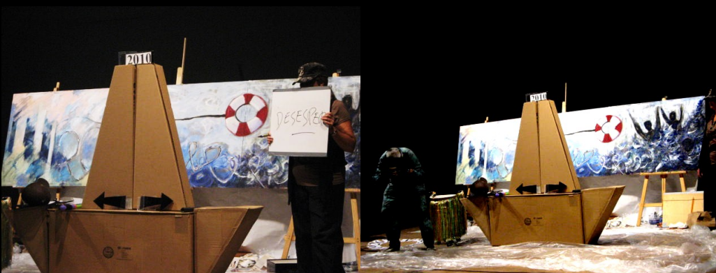
La situación era insostenible