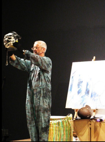
El acto final había llegado